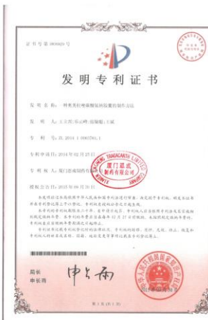
一种奥美拉唑碳酸氢钠胶囊的制作方法 专利号: ZL 2014 1 0063761.1