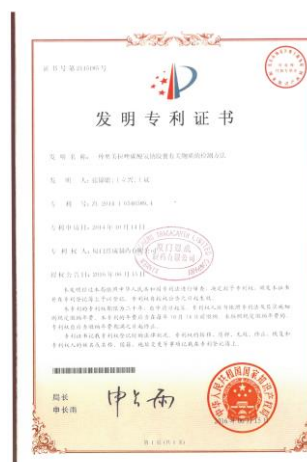
一种奥美拉唑碳酸氢钠胶囊有关物质的检测方法 专利号: ZL 2014 1 0540589.4